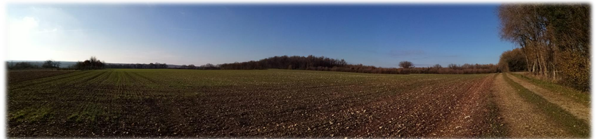
Photographie panoramique de l'aire d'étude, NCA Environnement, 7 décembre 2020