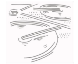
Hydraulique urbaine Eau et Assainissement